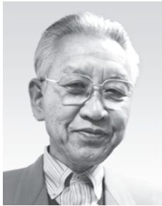
情報部門委員会 委員長