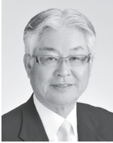
2015-16年度 RI第2630地区ガバナー